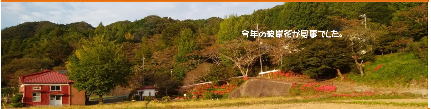
今年の彼岸花が見事でした。