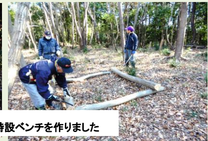
休憩用に特設ベンチを作りました