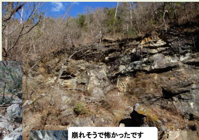
崩れそうで怖かったです