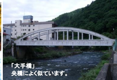
「大手橋」 央橋によく似ています。