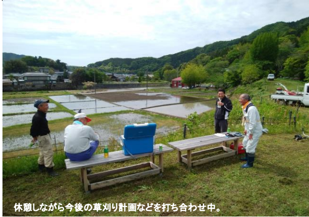
休憩しながら今後の草刈り計画などを打ち合わせ中。

5月1日に水路回り土手の草刈りを行いました。 あじさいも順調に生育していますが、イノシシに 荒らされて数株が枯れたりしています。