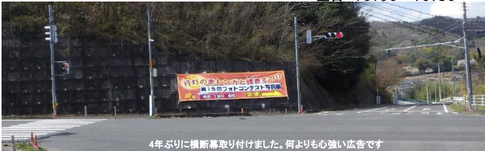
4年ぶりに横断幕取り付けました。何よりも心強い広告です

開催期間 令和5年4月1日(土)～9日(日) 平日 10:00～16:00 土日 10:00～16:30