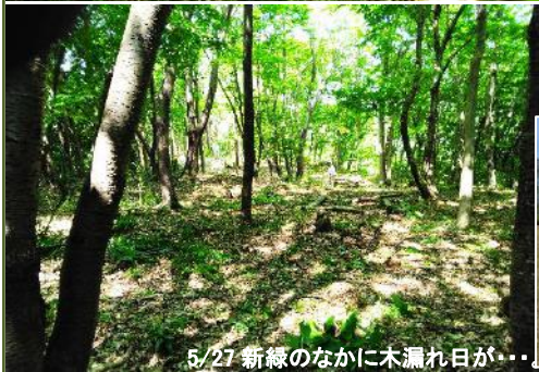
5/27 新緑のなかに木漏れ日が...