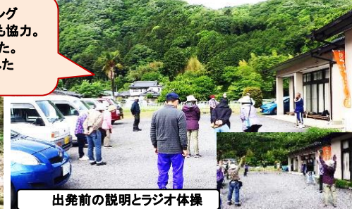
出発前の説明とラジオ体操