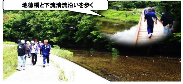
地徳橋と下流清流沿いを歩く