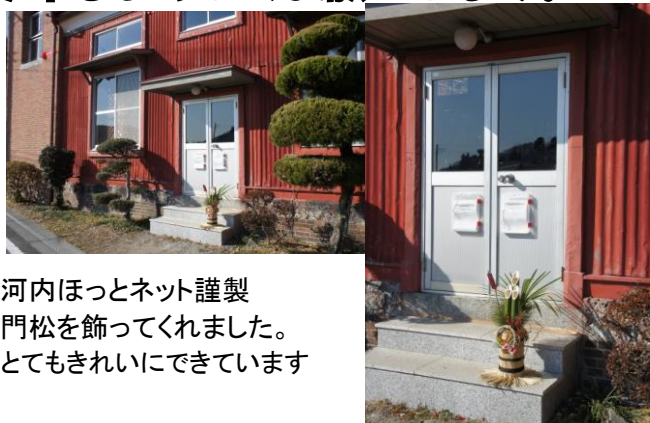
河内ほっとネット謹製 門松を飾ってくれました。 とてもきれいにできています