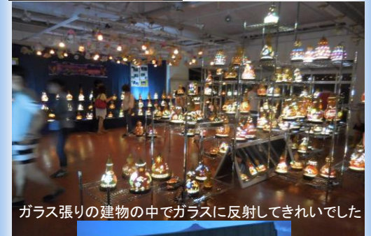
ガラス張りの建物の中でガラスに反射してきれいでした