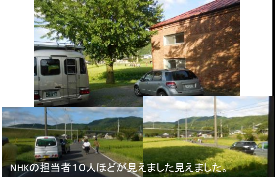
NHKの担当者10人ほどが見えました見えました。

NHK朝ドラ 来年4月からは茨城が舞台。 昭和30年代のシーンで 旧町屋変電所と宿通りを下見に来ました。